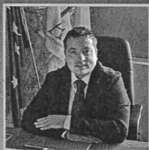
Interviene: Marcello PACIFICO Presidente nazionale